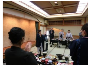
日本の宿古窯にて昼食と施設見学 女将と若女将にご挨拶頂きました。